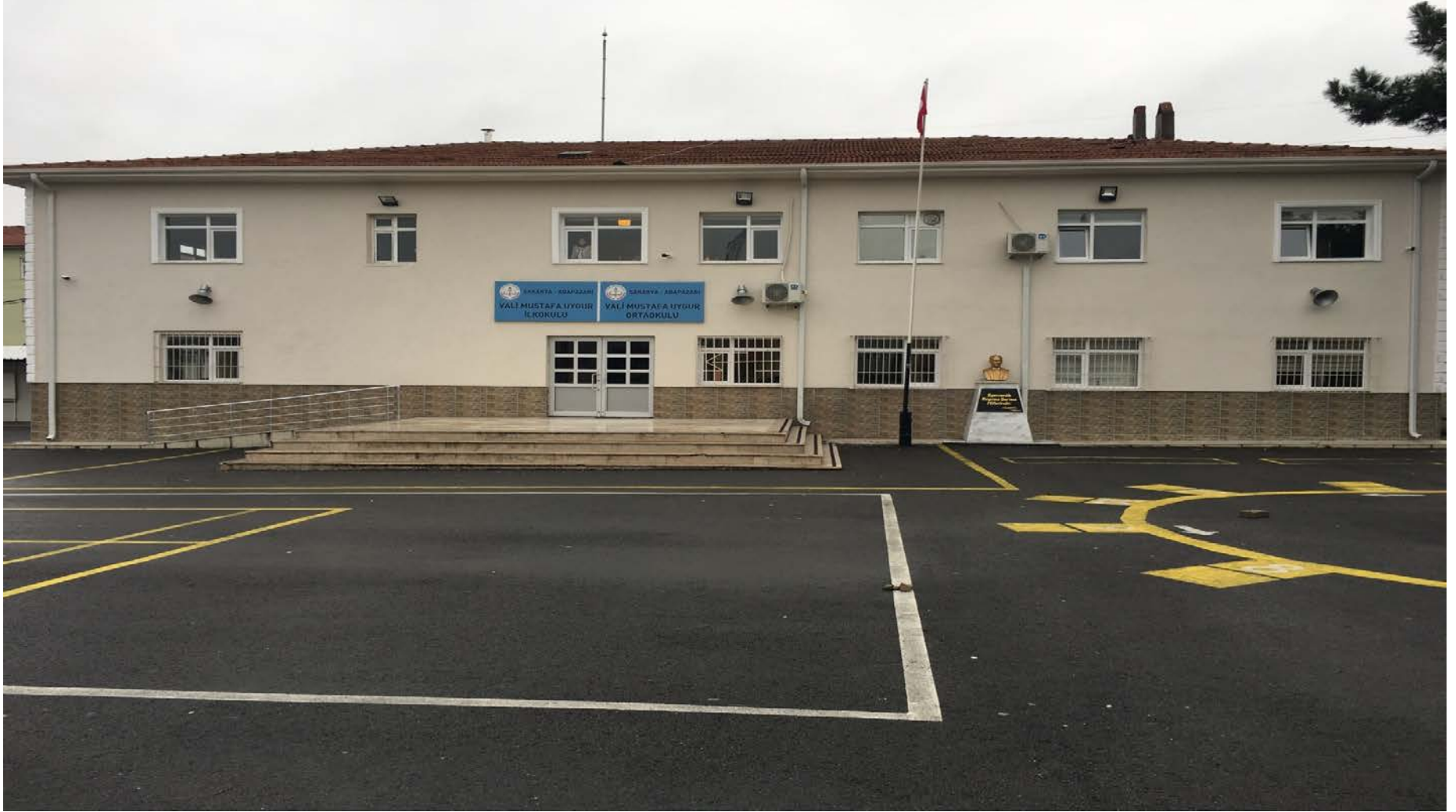
VALİ MUSTAFA UYGUR ORTAOKULU